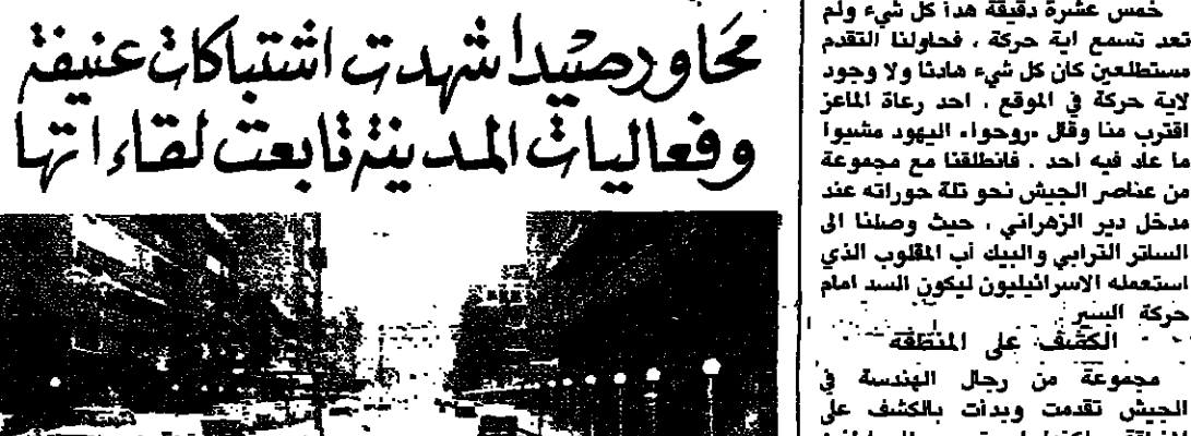
جنود مندسة يتخفون على المواقع